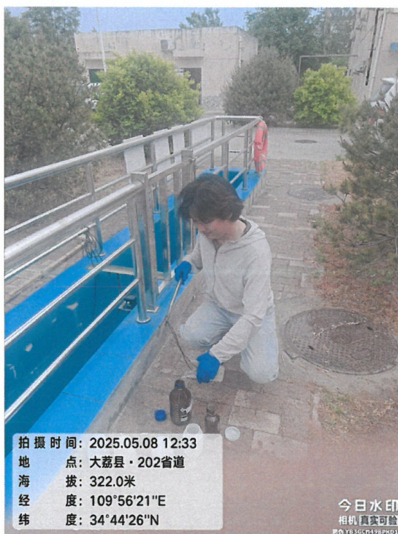
图 2 废水监测